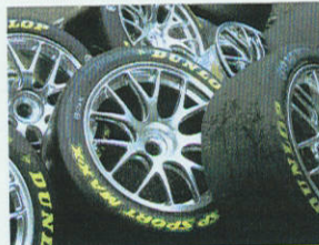
Dunlop-Reifen auf der Nordschleife ein Schlüssel zum Erfolg